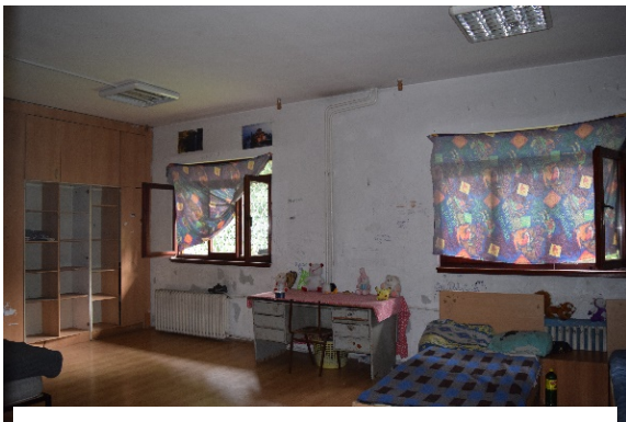
Слика 1- Машка соба

Спалните соби на децата-корисници, и за машките и женските деца се наоѓаат во еден ист оддел, и ги дели само ходник. Притоа, вратите на ниту една од собите не се затвораат, поради што најчесто столчето е замена за клуч. Во вакви услови, децата немаат обезбедено приватност ниту сугурност. Имено, Собите се со капацитет не повеќе од 5 легла и истите располагаат со многу оскуден и застарен, едвај употреблив инвентар, кој се состои од кревет, гардеробер без врати за затворање и стол. Во овој објект корисниците го поминуваат целото време. Нема опремена заедничка просторија за дневен престој во која би го поминувале своето слободно време, во релаксирачки активности, односно немаат на располагање ТВ, компјутер, ниту пак телефон. Од остварениот разговор со стручната служба, како и со дел од корисниците, произлезе дека корисниците воопшто немаат организирани активности со кои би било исполнето слободното време, недостасуваат рекреативно-креативни активности, работна окупација и ангажман, согласно индивидуалните потреби, можности и способности, што е голема негативност.