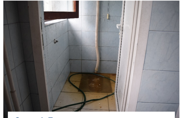
Слика 4- Тоалет