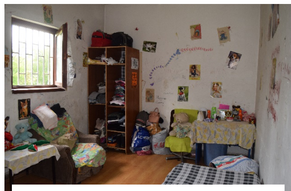
Слика 2- Женска соба