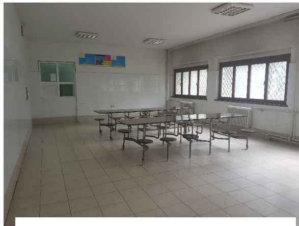
Слика 5- Трпезарија

Храната се приготвува во кујна и оброците се делат во трпезарија. Овие простории се наоѓаат во одделен објект во склоп на установата. Во овој дел, хигиената е на задоволително ниво, а во разговорот со корисниците и со дел од персоналот, произлегува дека исхраната е разновидна, секојдневно има зеленчук и овошје, согласно пропишаните стандарди. Забелешка е дека корисниците во установата, воопшто не се вклучени при изготвување на неделното мени за храна, и во разговор со децата истите изразија незадоволство од видот на храната што им се дава. Се внимава на верската припадност на корисниците при подготвување на оброците, односно се почитуваат нивните верски обичаи.