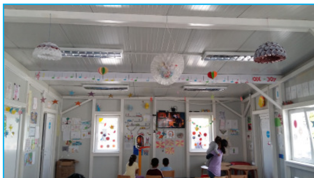
Градинка „La Strada“

Невладината организација „Легис“ со своето постојано присуство во Привремениот транзитен центар, дополнително помагаат во неговото функционирање преку разни донации на храна, облека, обувки и лекови.