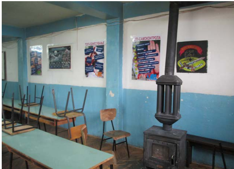
Слика 10. Просторија-училница

Од увидот се констатира дека има просторијата наменета за училница , која истовремено се користи и како занимална и соба за слободни активности, истата е добро осветлена и со запазена хигиена. Во училницата има 14 маси, односно клупи, 20 столици и една катедра. На ѕидот има истакнато Куќен ред на установата, Список на дежурства на деца и одговорни лица, како и Распоред на активности во ВП Домот. Затоплувањето на просторија се врши со огревно дрво.