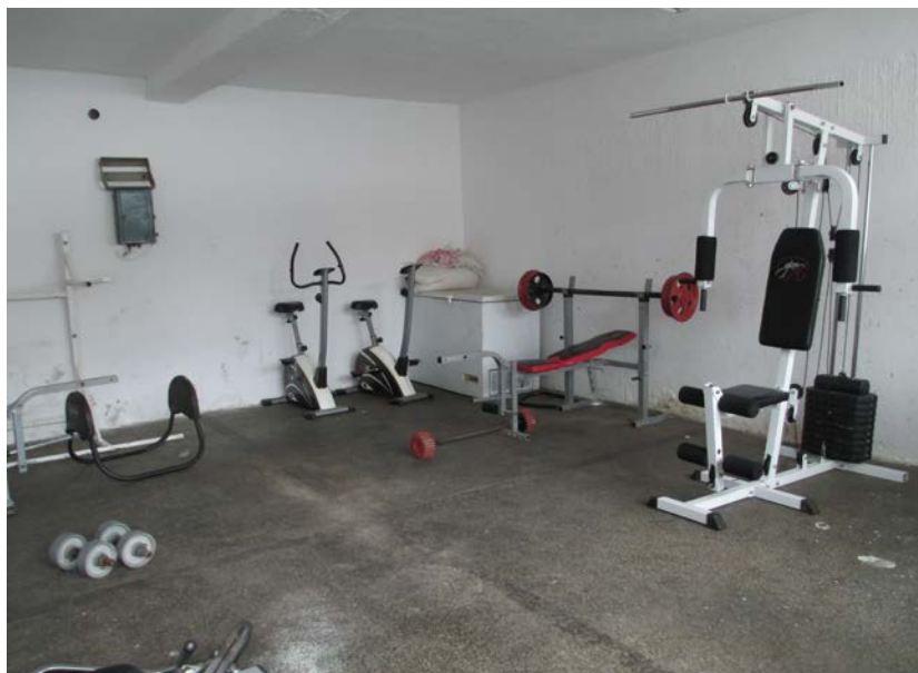
Слика 3. Истата просторија при втората посета