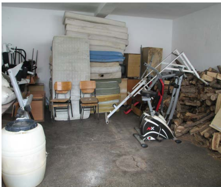
Слика 2. Просторија наменета за сала за вежбање (при првата посета)