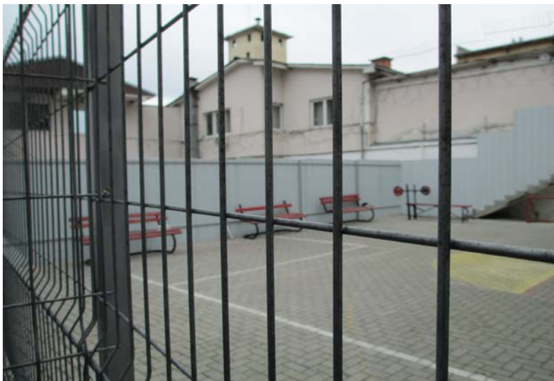
Слика 14. Дворот, поделен на два дела за малолетниците и за осудениците

Добиени се информации од децата дека спортско- рекреативните активности најчесто се изведуваат во дворот на Домот кој со лимена ограда физички е одвоен од дворот кој го користат осудените малолетници. Инаку, дворот е со мали димензии и не ги задоволува основните потреби на децата по однос на целосна рекреативна активност. Воедно во дворот не е предвиден покриен дел кој би се користел во лоши временски услови. При втората посета огревното дрво беше отстрането од просторијата, но просторијата повторно беше заклучена и не беше во функција.