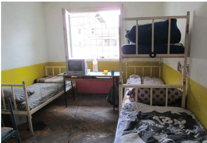
Слика 4. Одделение за засилено превоспитно влијание

Првата просторија која функционира како Одделение за засилено превоспитно влијание (ОЗПВ) е од затворен тип. Просторијата е со димензии 5,6x3,1 м и висина на плафонот од 2,5 м или 47,7 м 3 . Прозорците во собата се обезбедени со метални решетки и овозможуваат природна светлина и вентилација на просторијата. На подот има паркет кој на неколку места е оштетен. Просторијата е чиста, сидовите се релативно добри. Оваа просторија има 5 двокатни метални кревети, а во моментот на посетата во истата беа сместени 4 деца.