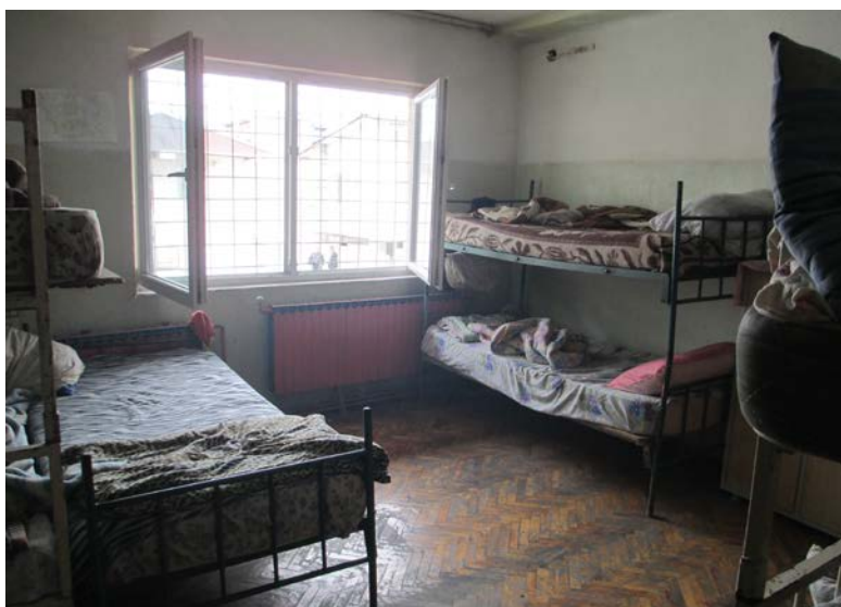
Слика 5. Простории (од отворен тип) во кои се сместени децата

Во овие две простории има прозорци со метални решетки, просториите се добро осветлени и со запазена хигиена. Во сите три простории има телевизиски апарат, и посебно шкафче за секое дете за чување на неговите работи. Надворешната страна на вратите од овие простории секоја поодделно има метална влезна врата со решетки, кои во моментот на посетата беа отворени. Инаку втората и третата просторија се од отворен тип.