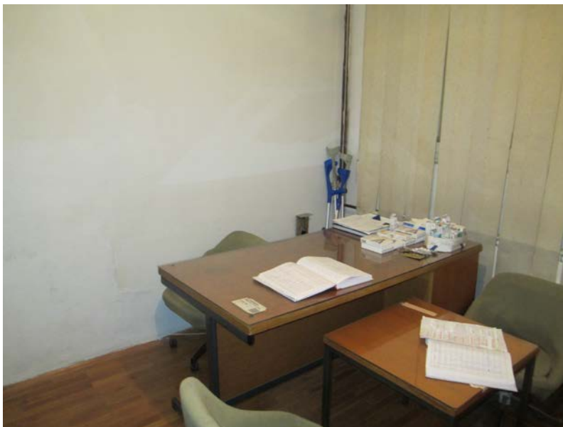
Слика 12. Амбулантата каде се прегледуваат децата