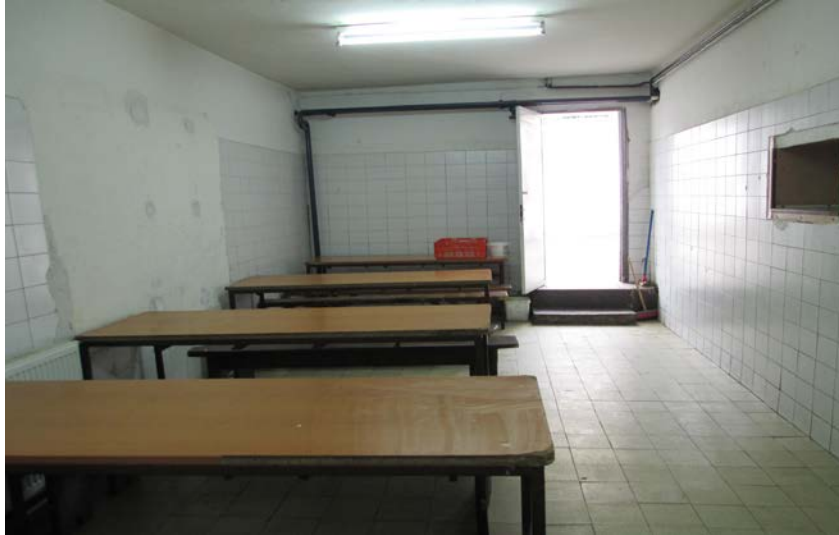
Слика 7. Трpezарија

Истата просторија ја користат и осудените лица од затворот, но во различни временски термини во денот. На видно место во кујната има истакнато мени за 15 дена, кое е подготвено од инструкторот (готвачот), прегледано од лекарот, а одобрено од директорот на установата. Во разговор со лицата кои се ангажирани во кујната добиени се информации дека во изготвувањето на менито учествуваат индиректно децата, преку друго дете кое е на издржување казна малолетнички затвор и е со сертификат за готвач издаден од надлежна институција. Оброците се служат три пати дневно- појадок, ручек и вечера.