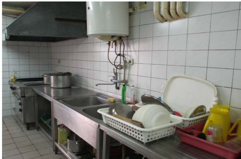
Слика 6. Дел од кујната каде се приготвува храната

Готвенењето на храната за децата од ВПД Тетово се врши во посебна просторија- кујна која е мала по димензии, но ги има основните елементи: три работни маси, ладилник, шпорет, мијалник, како и две наткасни за чување на приборот за јадење (чини, прибор исл.) . Делењето на оброците за децата се врши преку отвор (шалтер), а храната се конзумира во просторија која е веднаш до кујната и се користи за трпезарија. Трпезаријата има пет долгнавести маси и десет долгнавести клупи за седење.