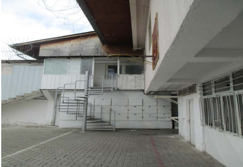
Слика 15. Влезот во воспитно–поправниот дом

Во разговор со директорот добиени се информации дека има и пинг-понг маса, која е планирано да биде поставена во дворот , но поради временските услови не може да се користи од причина што нема покриен дел.