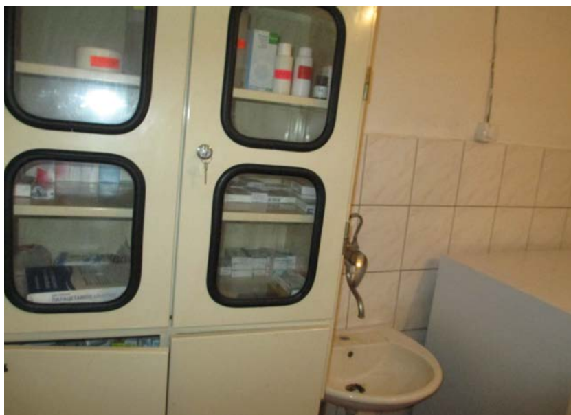
Слика 13. Шкаф за чување на лекаствата