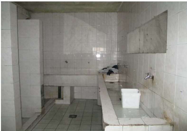
Слика 8. Бања