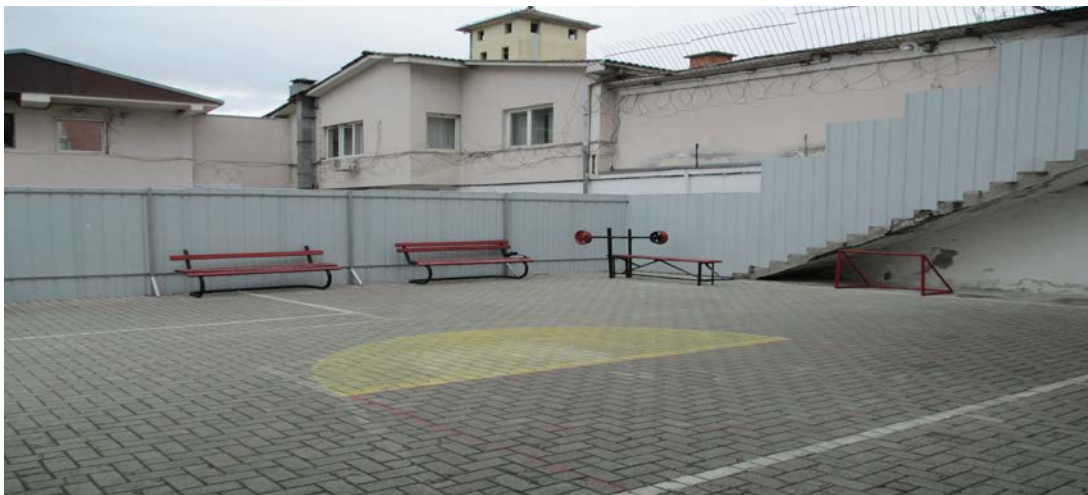
Слика 1. Дворот на установата за децата од Воспитно поправен дом

Во разговор со директорот на КПУ за локацијата на установата, добиени се сознанија дека имало ситуации кога од околните објекти, особено за време на туристичка сезона, лицата сместени во овие објекти разговараат со децата или со осудените лица кога се наоѓаат во дворот, на отворено и притоа да им се дофрлат мобилни телефони или други предмети кои се забранети со Куќниот ред. До Министерството за правда и Управата за извршување на санкциите пред неколку години од страна на директорот е доставено барање за дислокација на Затворот Охрид и според информациите истиот е на листата на казнено-поправни установи за дислокација, согласно Националната стратегија за пенитенцијарниот систем 2015-2019 година.